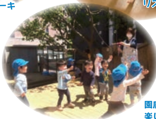
園庭や室内遊びを 楽しめます