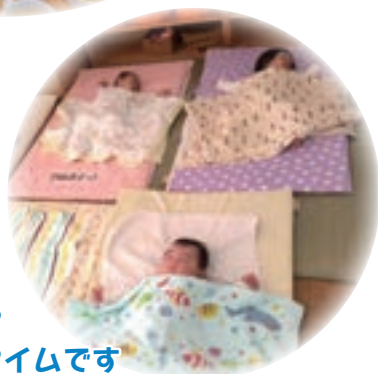
スヤスヤ お昼寝タイムです