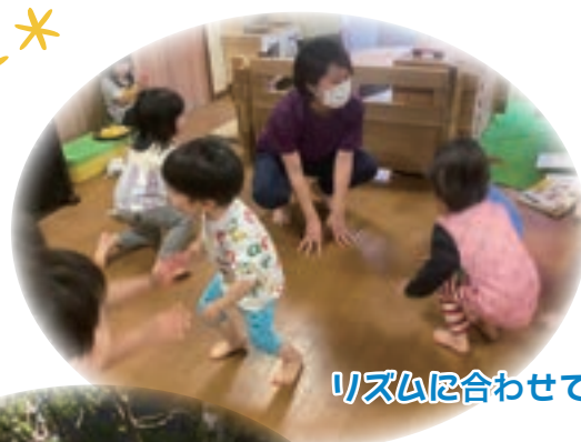
リズムに合わせて～