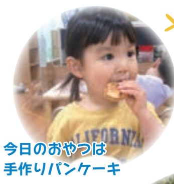
今日のおやつは 手作りパンケーキ